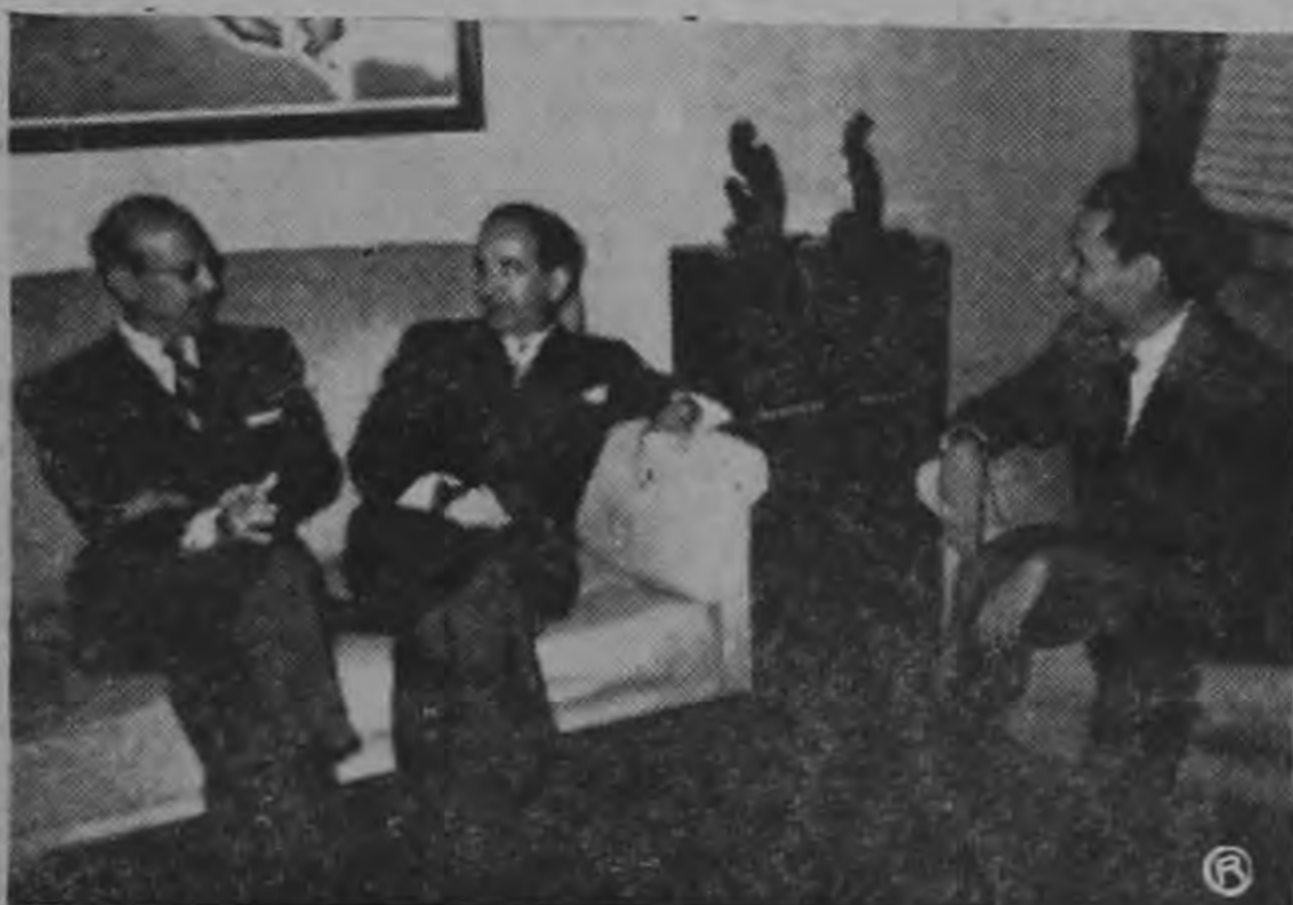
Con el Presidente Figueres aparecen en la gráfica los Directores del Servicio Civil de El Salvador y de Costa Rica. Llegaron a hacerle una visita de cortesía, a la vez que para cambiar impresiones con relación a las labores que ambos vienen desarrollando en materia de servicios civiles.