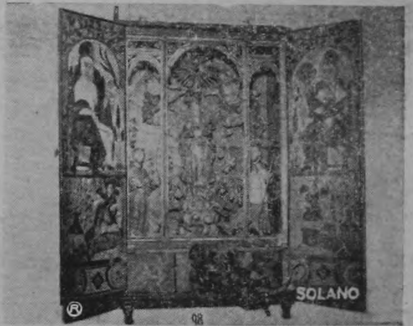
Este camarín de la Virgen del Rescat, conocida popularmente como la Virgen del Diablo, es una de las más interesantes que se exponen. Abajo figura el infierno personificado por el diablo.