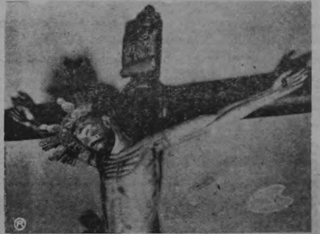
Cristo, de escultura policroma, también de la Colonia.